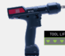
EL TIEMPO DE VIDA DE LA HERRAMIENTA SE EXTIENDE.